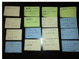
ビジネス現場を想定したグループワーク